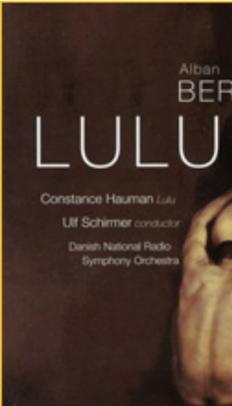
Emilia-Lulu en el escenario