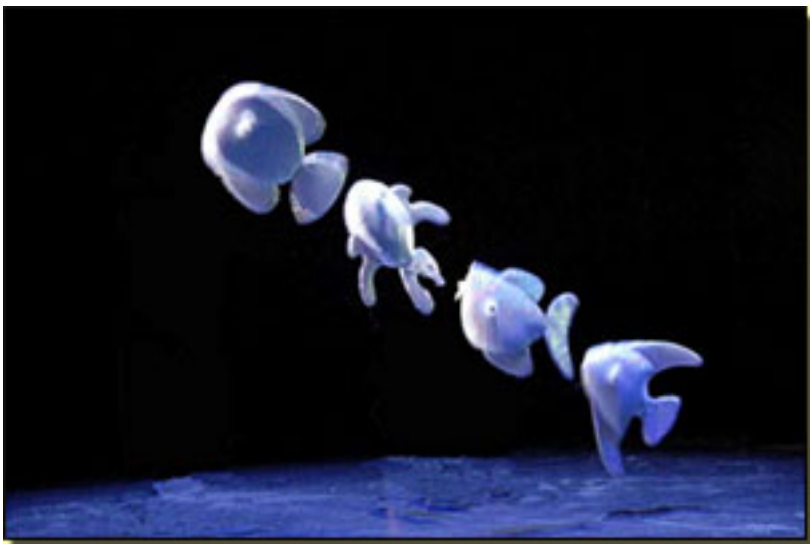
Bunraku: Técnica de títeres con varillas.