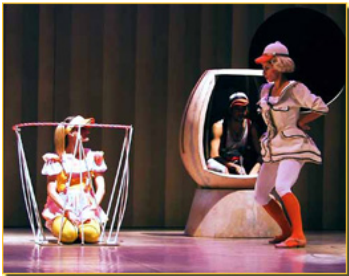
EL PATITO FEO

Domingo, 14 de Marzo de 2010 18:51 - Actualizado Jueves, 13 de Mayo de 2010 12:01