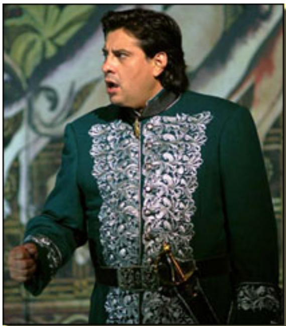
MARCELO ÁLVAREZ

Esta nueva dimensión vocal le permite estrenar próximamente en el Covent Garden Un ballo in maschera