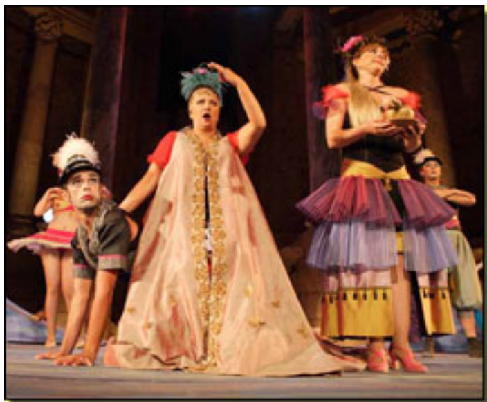
El joven Telémaco

Llegó a tener 33 representaciones seguidas y setenta y dos, durante la temporada. Llegó hasta los teatros privados como en el de la condesa de Montijo . Allí acudieron la infanta Isabel y su hija , los ministros de Brasil y de