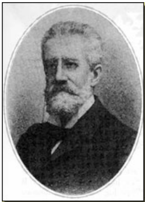
JAVIER DE BURGOS