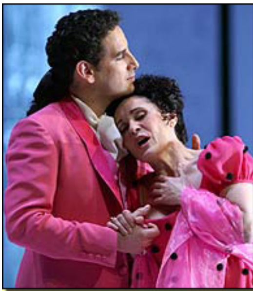
JUAN DIEGO FLOREZ/ MARÍA BAYO EL BARBERO DE SEVILLA (Versión de EMILIO SAGI)