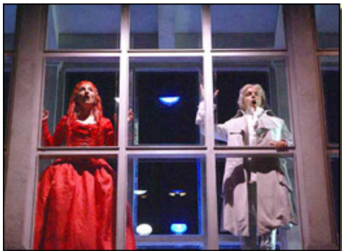
IL TUTORE BURLATO