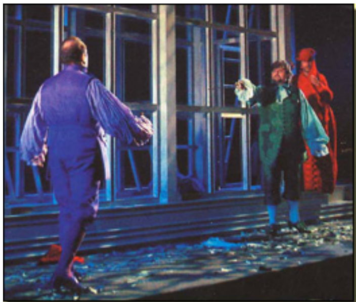
IL TUTORE BURLATO, 2006