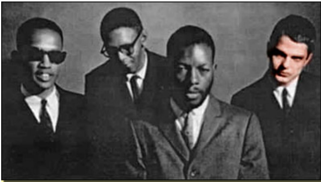
CHERRY – BLACKWEL – COLEMAN- HADEN

A finales de 1950 actúa junto a Ornette Coleman (Fort-Worth, 9 – III -1030), el cual liberó al jazz de estructuras cerradas agregando mayor libertad, rompiendo moldes armónicos y poniendo en solfa el concepto de armonía mediante cacofonías. Deja libertad para que sus músicos avancen por su cuenta. Esto llega al paroxismo es su disco Free Jazz .