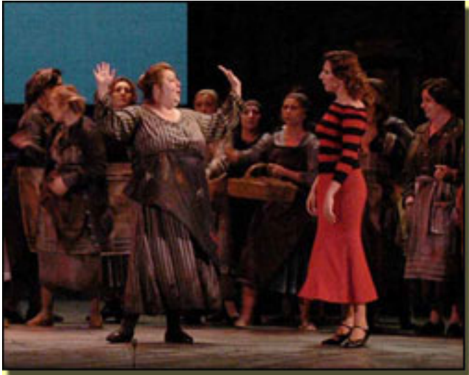
LA TABERNERA DEL PUERTO (2006)