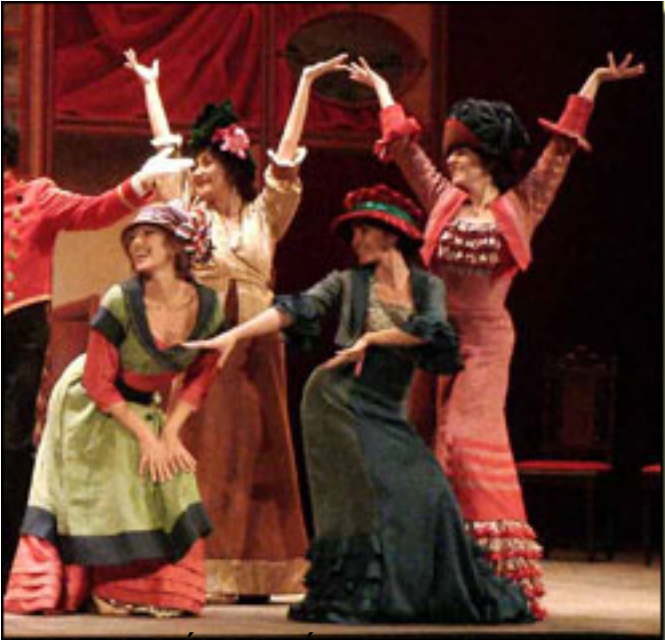
Las bribonas (1871), singing in the original production (1907) by Amelia

Viernes, 19 de Marzo de 2010 14:34 - Actualizado Viernes, 07 de Mayo de 2010 19:49