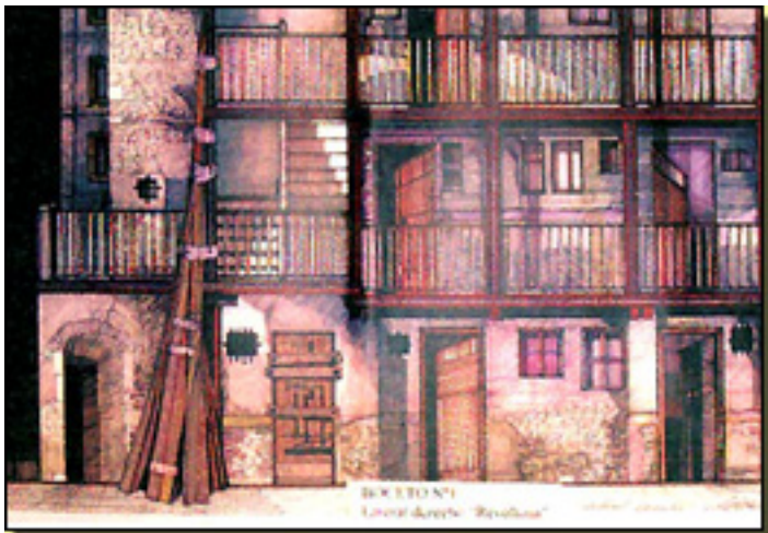
LA REVOLTOSA (BOCETO 2007)

Martes, 06 de Abril de 2010 07:37 - Actualizado Viernes, 07 de Mayo de 2010 19:47