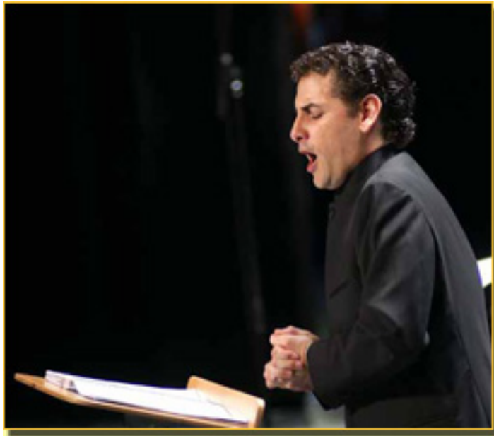
JUAN DIEGO FLÓREZ