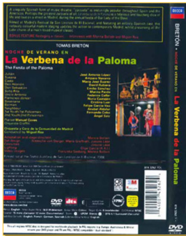
CONTRAPORTADA DEL DVD