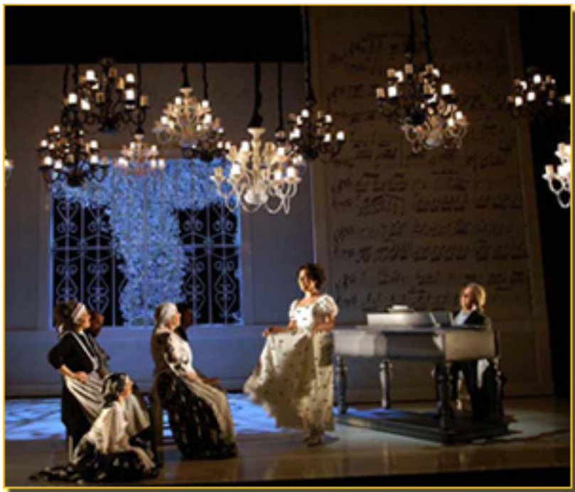
EL BARBERO DE SEVILLA