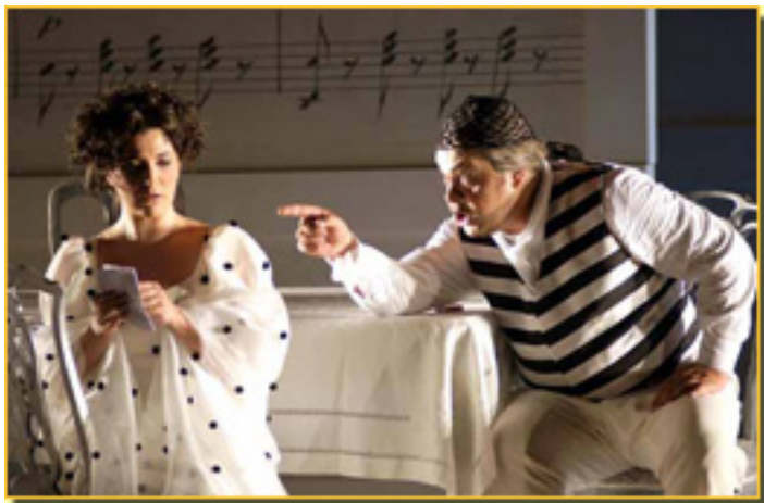
EL BARBERO DE SEVILLA

Sábado, 20 de Marzo de 2010 11:01 - Actualizado Sábado, 08 de Mayo de 2010 11:35