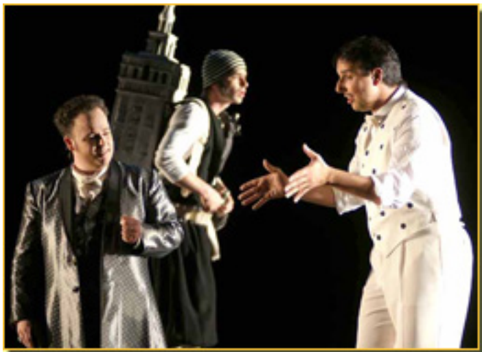
(EL BARBERO DE SEVILLA)

Sábado, 20 de Marzo de 2010 11:01 - Actualizado Sábado, 08 de Mayo de 2010 11:35