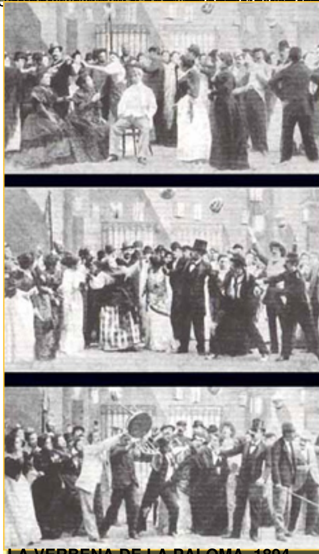
LA VERBENA DE LA PALOMA, 1894