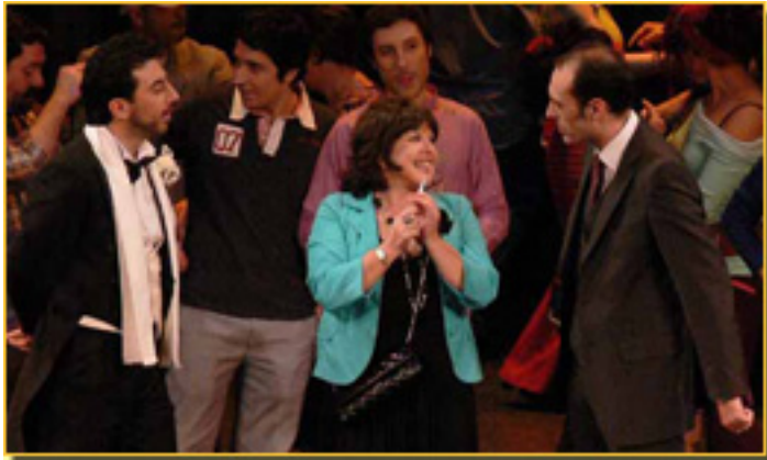
MARCO MONCOLA/LOLES LEÓN/