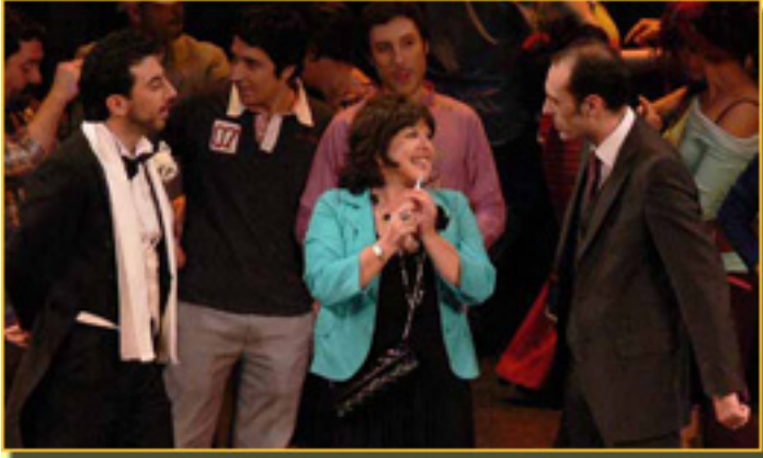
MARCO MONCOLA/LOLES LEÓN/