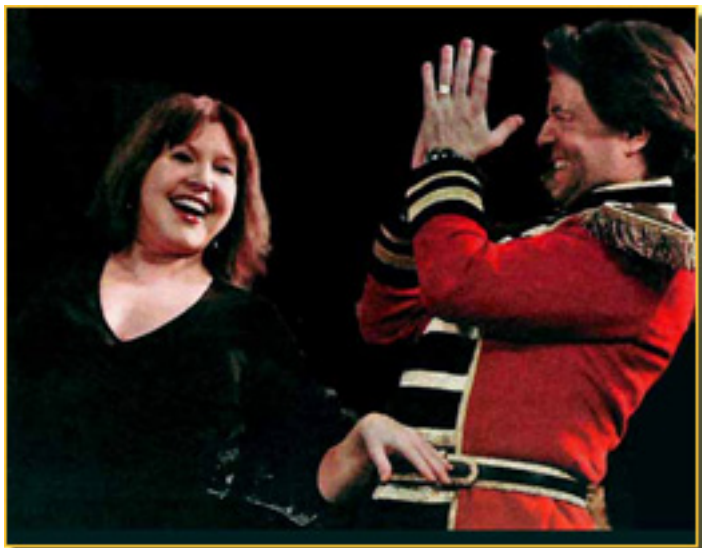
LOLES LEÓN/E. R. DELPORTAL

La Gran vía es género chico, ya saben que el apelativo no le viene por ser un género menor, sino por su duración 1 hora como máximo, tiempo demasiado corto para un espectáculo de hoy. Generalmente se representaba con otra obra del género chico. Los criterios de este “ayuntamiento” eran diversos y no vamos a entrar en ello. En el caso que nos ocupa,