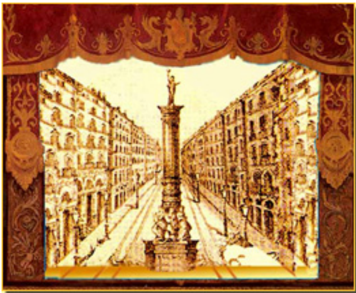
LA GRAN VÍA , 1886

■ La Gran Vía de Federico Chueca , no solamente fue un “boom” en su época sino que quedó en el repertorio y se representó con generosidad por todas las Compañías. Al Teatro de la Zarzuela ha venido en varias ocasiones. La última con versión de Adolfo Marsillach .