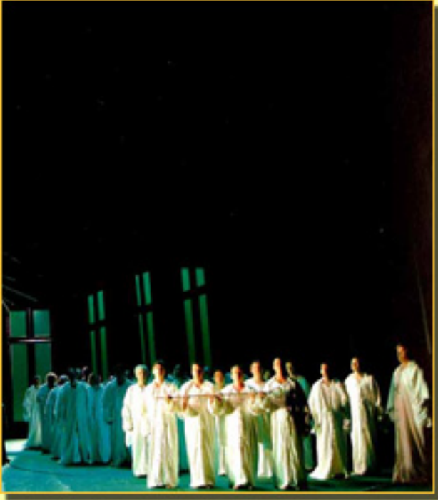
Junto a este realismo de Veritas ras sexuales que,

Martes, 09 de Febrero de 2010 08:40 - Actualizado Sábado, 08 de Mayo de 2010 14:05