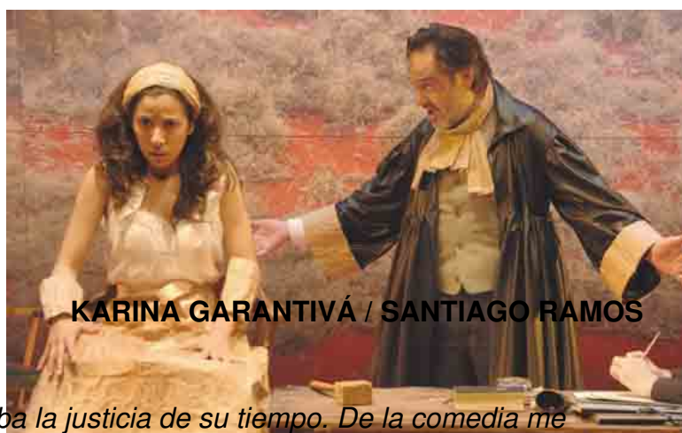
KARINA GARANTIVÁ / SANTIAGO RAMOS

Martes, 31 de Agosto de 2010 18:00 - Actualizado Domingo, 26 de Septiembre de 2010 06:55