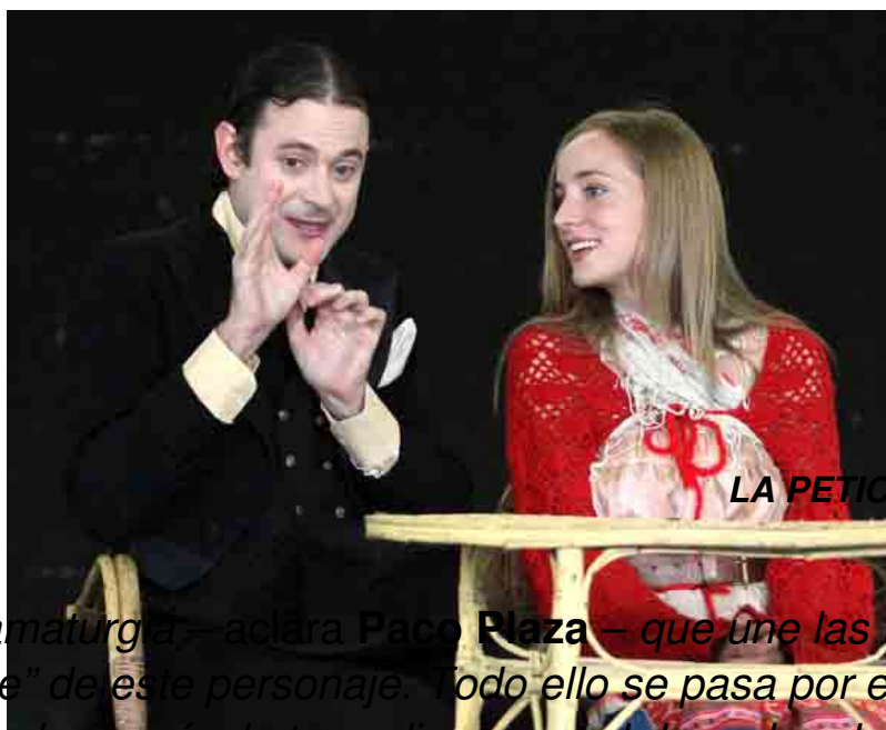
LA PETICIÓN DE MANO

El viaje del actor cuenta con las tres Chéjov de , pero no es un enchoriza