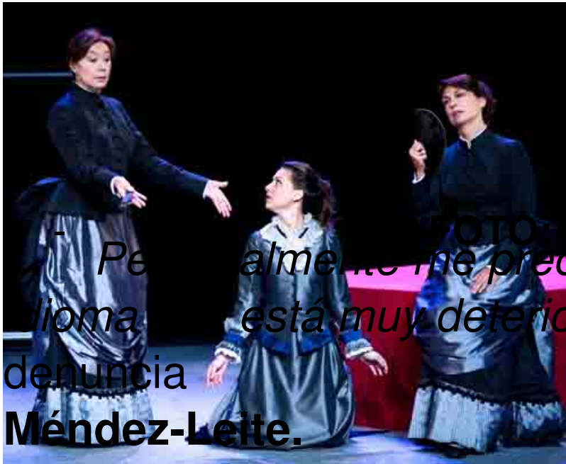
Personalmente me preocupa nuestro idioma que está muy deteriorado - denuncia Méndez-Leite.

Cada vez hablamos peor. El castellano de Galdós