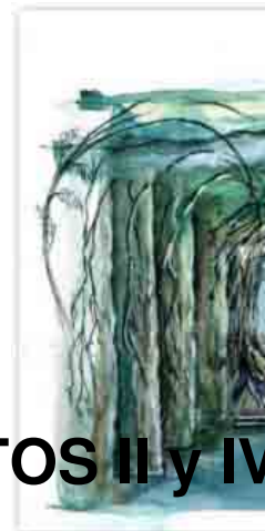
ACTOS II y IV