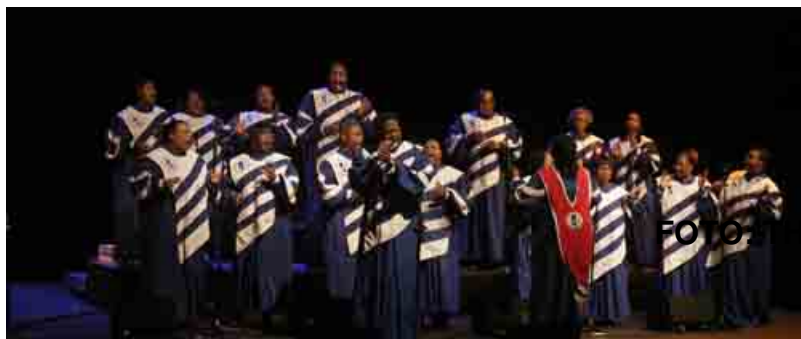
THE MISSISSIPPI MASS CHOIR