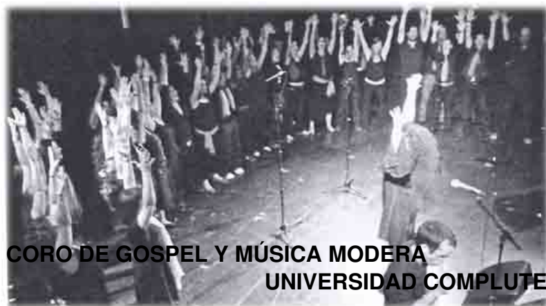
CORO DE GOSPEL Y MÚSICA MODERNA UNIVERSIDAD COMPLUTENSE DE MADRID

- ...excelente por la calidad de los grupos programados, que en el campo del Gospel y del Negro Spiritual son muy conocidos y muy consolidados.