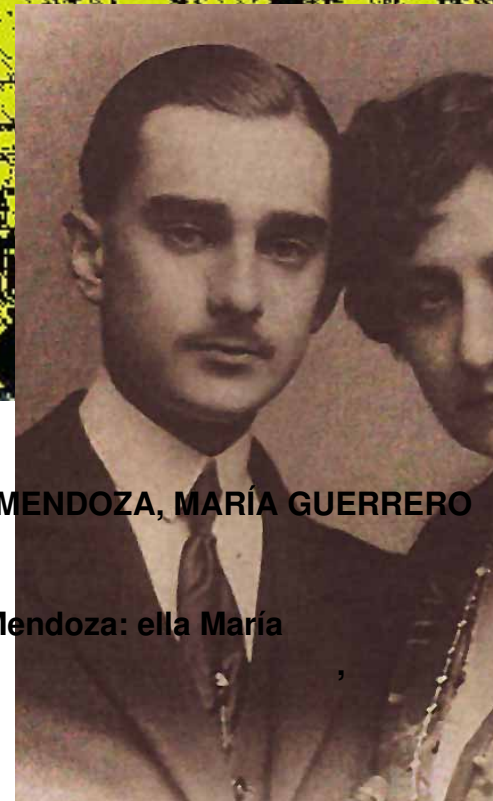
FERNANDO DÍAZ DE MENDOZA, MARÍA GUERRERO

En 1897 llegaba a Buenos Aires la compañía Guerrero- Díaz de Mendoza: ella María Guerrero