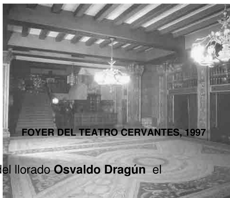
FOYER DEL TEATRO CERVANTES, 1997

. Sigue dependiendo de la Presidencia de la Nación, a través de la Secretaría de Cultura, pero goza de mayor independencia para administrar sus recursos y por supuesto, para definir los criterios artísticos a seguir.