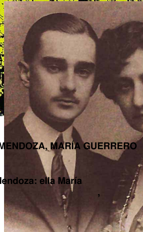
FERNANDO DÍAZ DE MENDOZA, MARÍA GUERRERO

En 1897 llegaba a Buenos Aires la compañía Guerrero- Díaz de Mendoza: ella María Guerrero