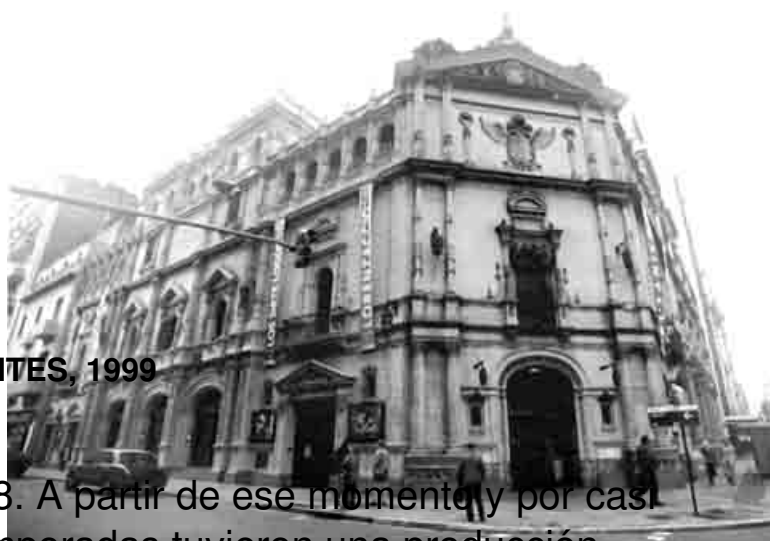
TEATRO CERVANTES, 1999

El Teatro Cervantes se reabrió en 1968. A partir de ese momento y por casi un período de casi tres décadas, las temporadas tuvieron una producción teatral heterogénea, que tuvo que lidiar con los vaivenes políticos, incluyendo la época de la dictadura.