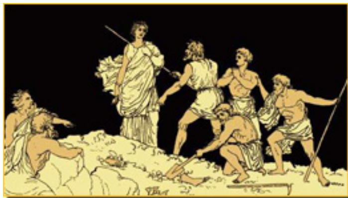
ANTÍGONA y el cuerpo de POLINICES

La ley y la sangre es la obra de mayor extensión en este volumen.