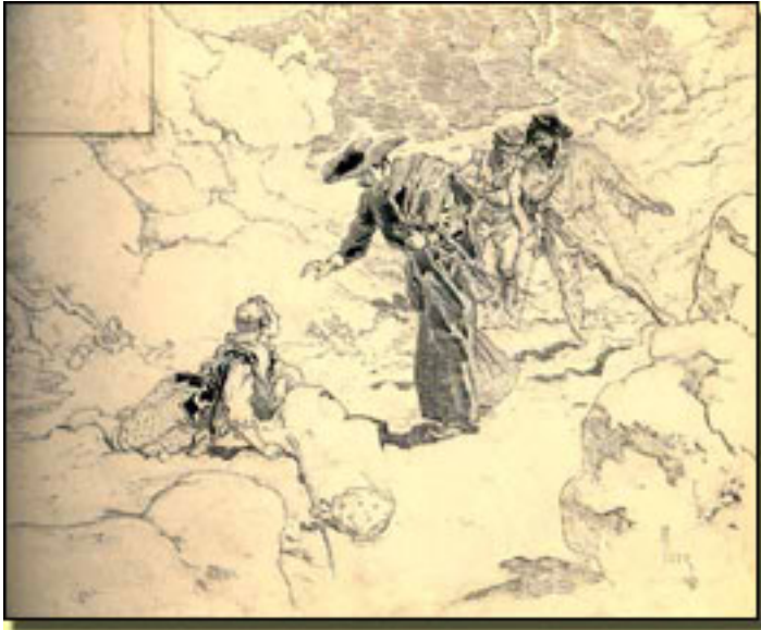
DANIEL U. VIERGE

Jueves, 15 de Abril de 2010 10:08 - Actualizado Viernes, 14 de Mayo de 2010 12:33