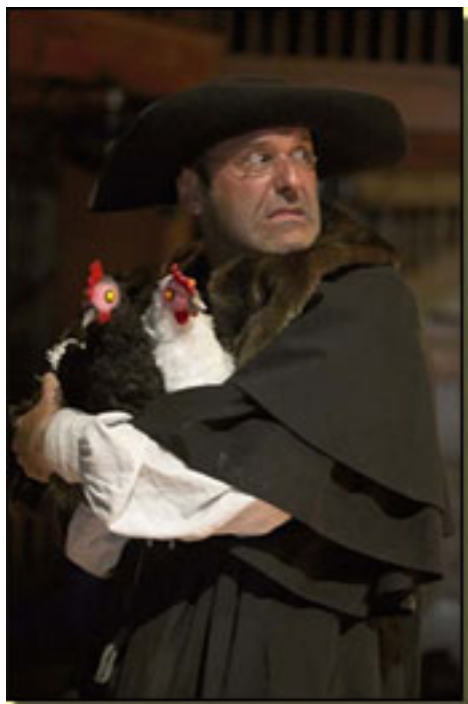
PEDRO DE URDEMALAS (ROYAL SHAKESPEARE COMPANY)

Con Cervantes llegaron a la escena mujeres graciosas, soldados famélicos y apicarados, renovadas celestinas, esposas adúlteras, maridos cornudos y contentos, aventureros, escribanos oportunistas, sacristanes, estudiantes aguafiestas y farsantes, héroes truculentos como Pedro de Urdemalas