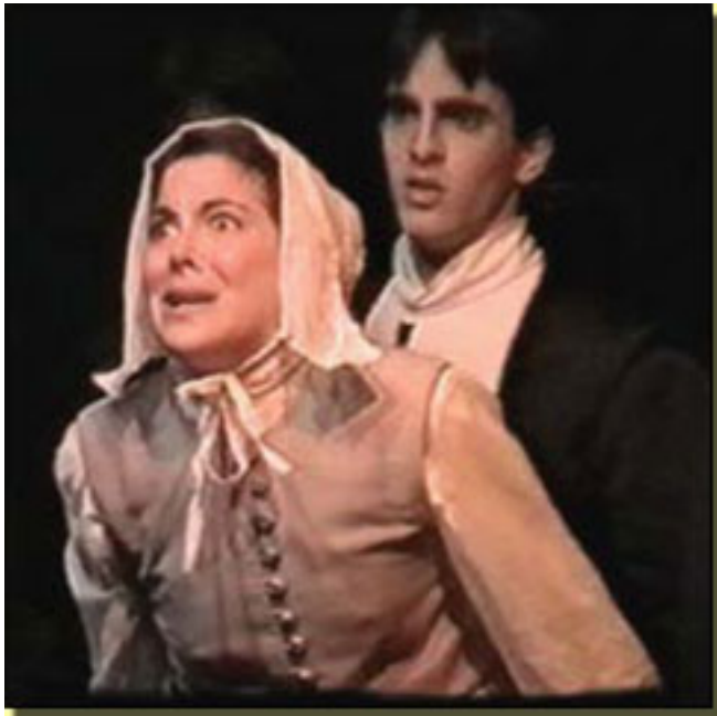
LAS BRUJAS DE SALEM TALLER DE TEATRO I.E.S. NAVARRO VILLOSLADA (2001/2002) PAMPLONA