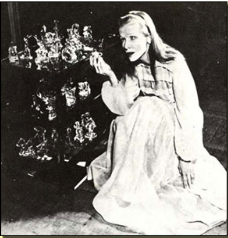
JULIE HAYDON (LAURA)