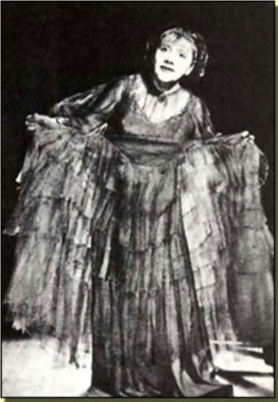
LAURETTE TAYLOR (AMANDA)

Escrito por Jerónimo López Mozo. Miércoles, 14 de Abril de 2010 15:24 -