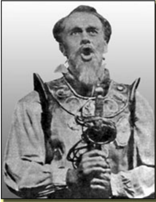
Richard Kiley (Estreno en N.Y.)

Miércoles, 14 de Abril de 2010 14:56 - Actualizado Jueves, 13 de Mayo de 2010 13:47