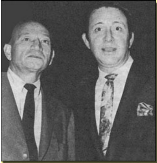
Dale Wasserman y Mitch Leigh

Miércoles, 14 de Abril de 2010 14:56 - Actualizado Jueves, 13 de Mayo de 2010 13:47