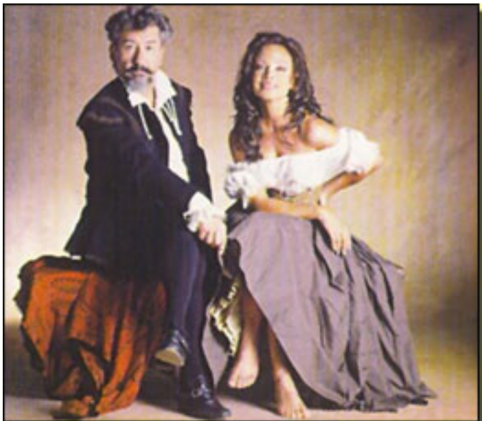
José Sacristán y Paloma San Basilio

Miércoles, 14 de Abril de 2010 14:56 - Actualizado Jueves, 13 de Mayo de 2010 13:47