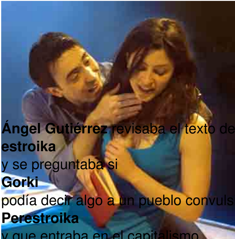
Gorki motivado por la Per