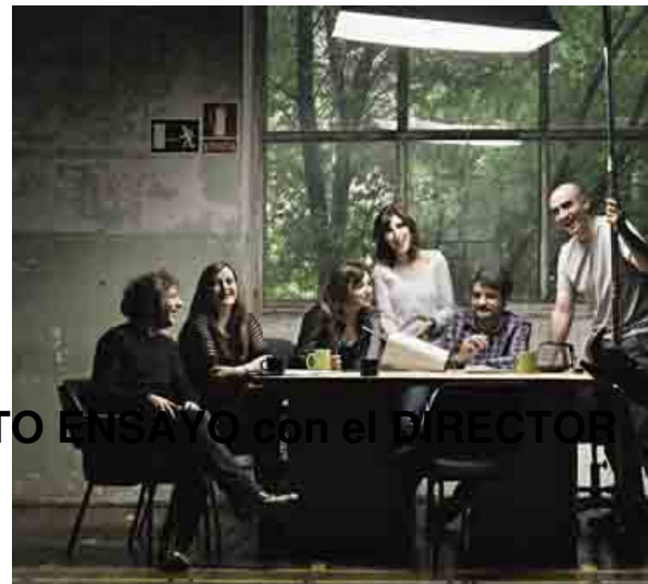
FOTO ENSAYO con el DIRECTOR