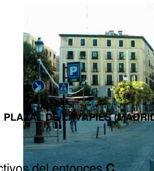
PLAZA DE LAVAPIÉS (MADRID)

se celebra al aire libre, y el único que se desarrolla con carácter anual y con sus características”