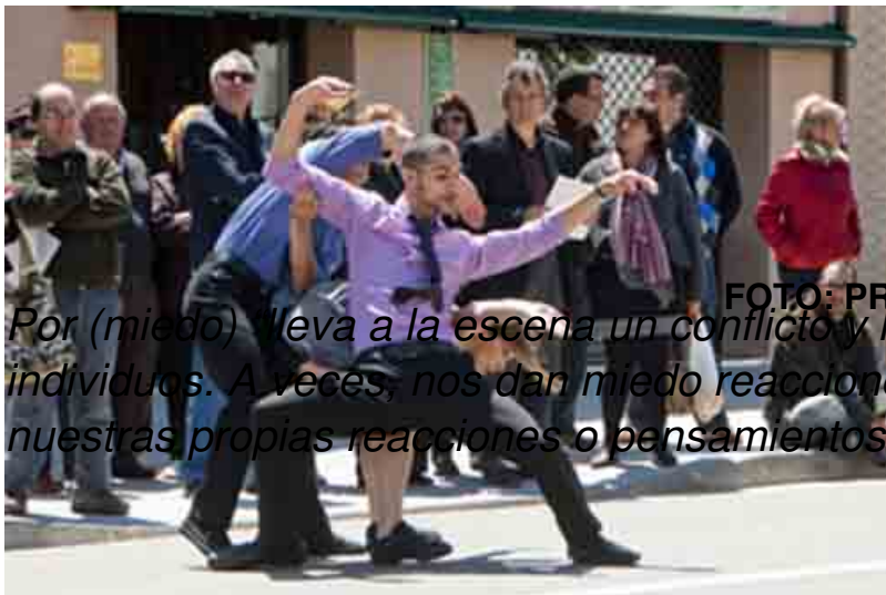
FOTO: PROYECTO D RUSES Por (miedo) lleva a la escena un conflicto y lucha de miedos entre individuos. A veces, nos dan miedo reacciones de las personas. Inclusive nuestras propias reacciones o pensamientos”.

Viernes, 27 de Mayo de 2011 16:57 - Actualizado Sábado, 13 de Agosto de 2011 14:57