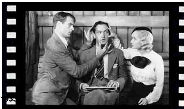
DESIGN FOR LIVING , 1933 ERNST LUBITSCH GARY COOPER, FREDERICK MARCH, MIRIAM HOPKINS