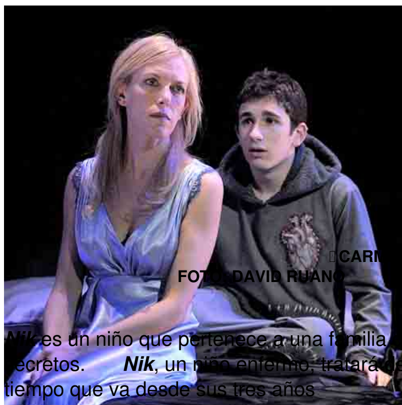
□ CARMEN CONESA / DAVID CASTILLO

Nik es un niño que pertenece a una familia que oculta una serie de secretos. Nik , un niño enfermo, tratará de descubrirlos en un espacio de tiempo que va desde sus tres años hasta los siete años.