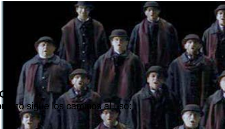
Escénicamente el Coro no sigue los caminos al uso:

Viernes, 09 de Diciembre de 2011 10:59 - Actualizado Viernes, 09 de Diciembre de 2011 12:24