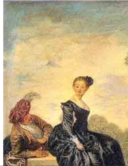
▣ LA BOUDEUSE