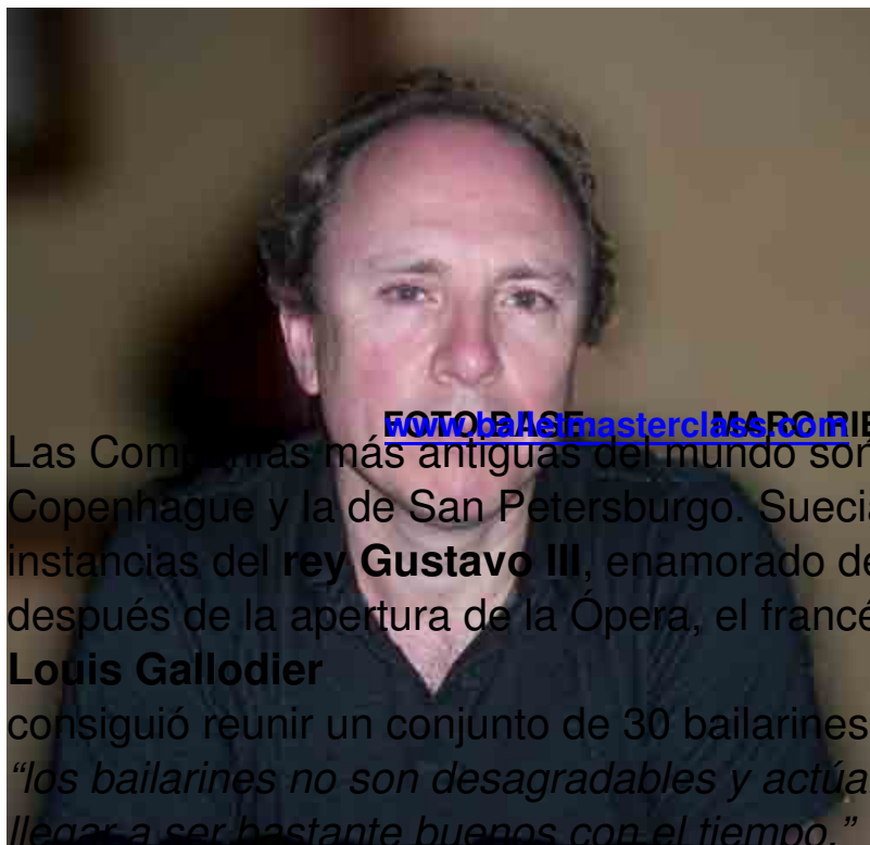
FOTOBASE masterclass.com MARC RIBAUD

Las Compañías más antiguas del mundo son tres: la de París, la de Copenhague y la de San Petersburgo. Suecia se incorpora en 1773 a instancias del rey Gustavo III , enamorado del ballet. Sólo unos meses después de la apertura de la Ópera, el francés