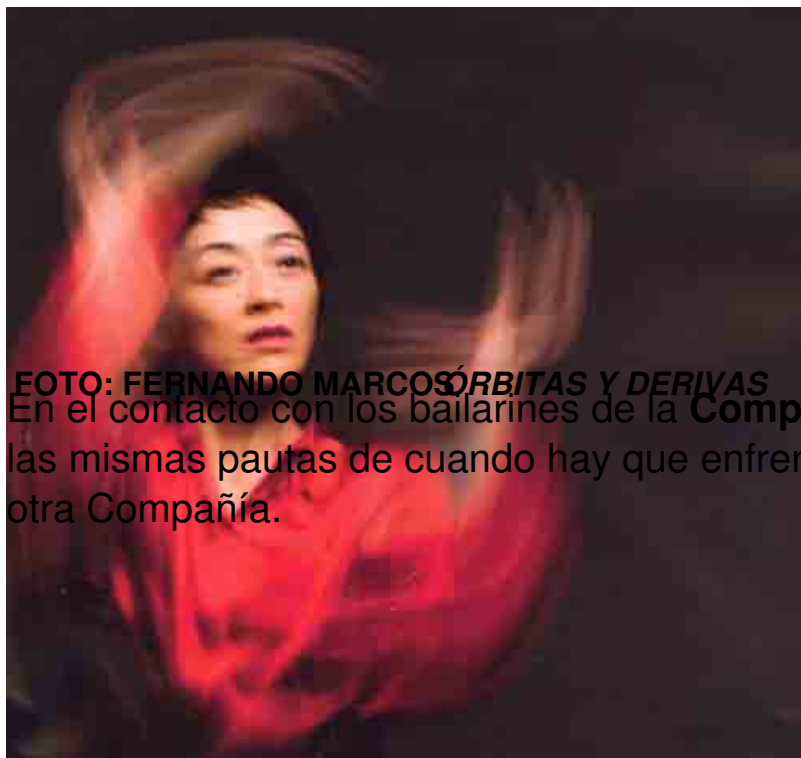
ÓRBITAS Y DERIVAS

En el contacto con los bailarines de la Compañía Nacional de Danza sigue las mismas pautas de cuando hay que enfrentarse con unos bailarines de otra Compañía.