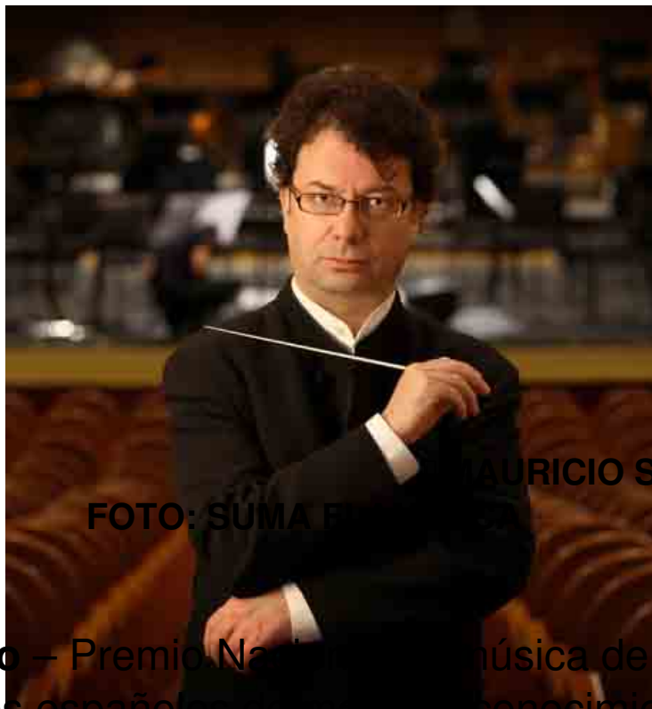
MAURICIO SOTELO

Mauricio Sotelo – Premio Nacional de Música de 2001 – es de los compositores españoles de mayor reconocimiento y rango internacional. Ha desarrollado un peculiar sonido musical que los críticos definen como “sabor añejo” y que en Europa se ha denominado