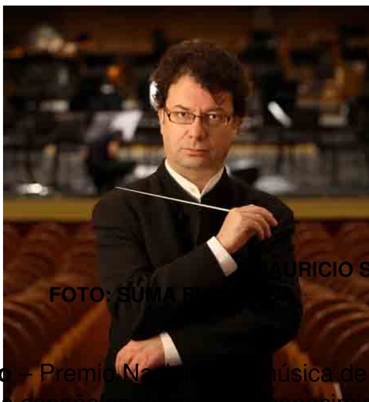
MAURICIO SOTELO

Mauricio Sotelo – Premio Nacional de Música de 2001 – es de los compositores españoles de mayor reconocimiento y rango internacional. Ha desarrollado un peculiar sonido musical que los críticos definen como “sabor añejo” y que en Europa se ha denominado