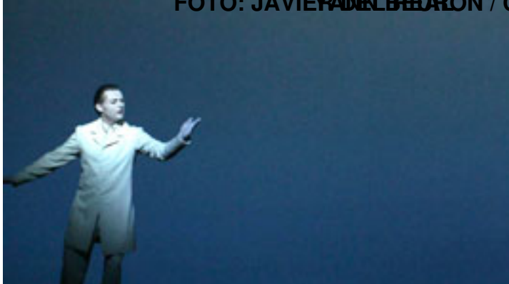
CAMILLA TILLING