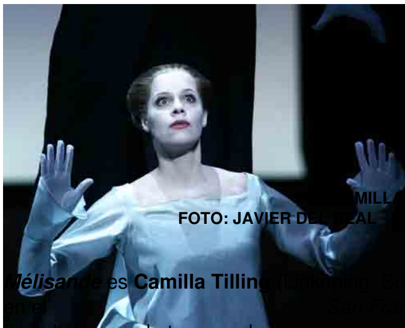
CAMILLA TILLING

Mélisande es Camilla Tilling (Londres, Inglaterra), cuya voz nos sorprendió en el Sanctus de San Francisco de Asís (CLIKEAR) , al final de la pasada temporada, es una joven soprano que ha debutado en los mejores escenarios líricos. En el