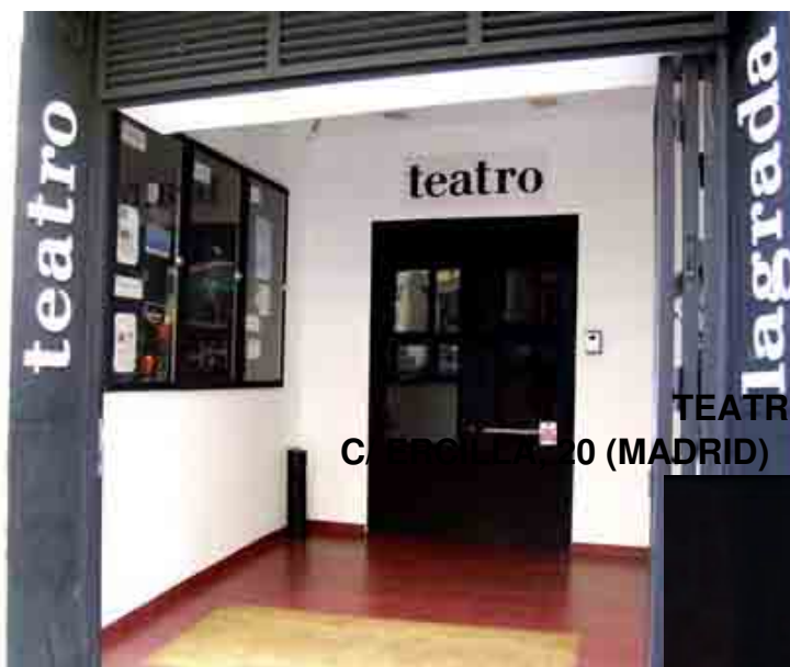
TEATRO LA GRADA CALLE DE CALZADA 10 (MADRID)