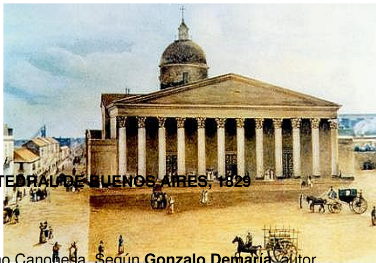
CATEDRAL DE BUENOS AIRES, 1829