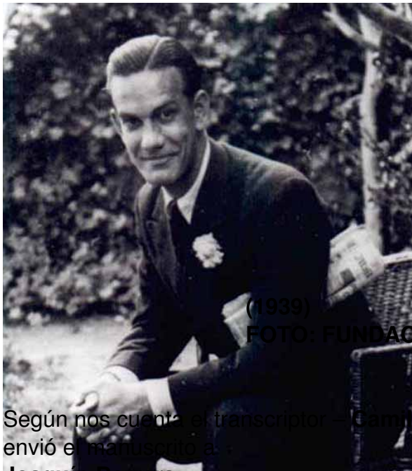
CAMILO JOSÉ DE CELA

(1939)