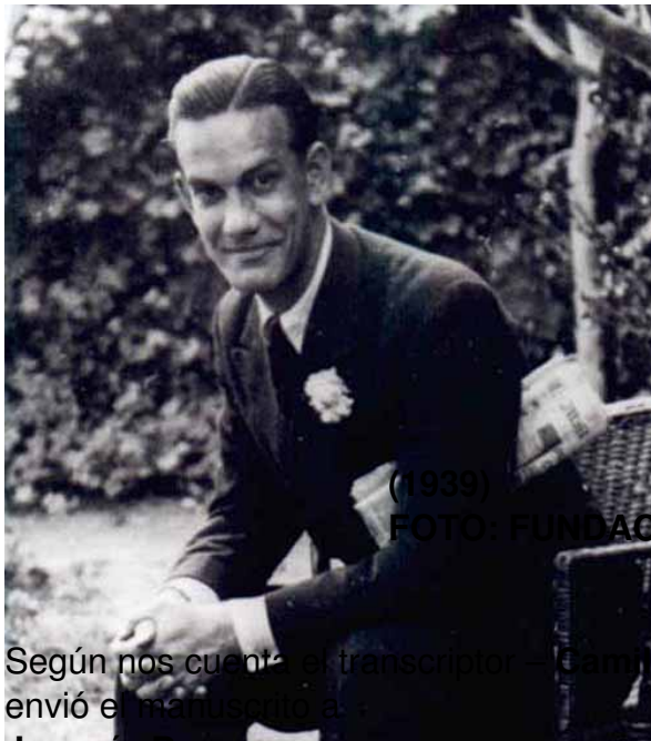
CAMILO JOSÉ DE CELA

(1939)