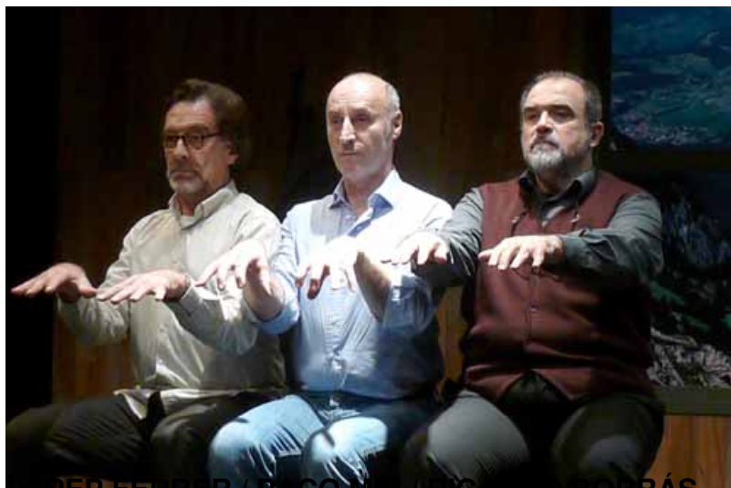
PEP FERRER / PACO SIBLEYRAS

Viernes, 15 de Noviembre de 2013 09:07 - Actualizado Sábado, 07 de Diciembre de 2013 09:52