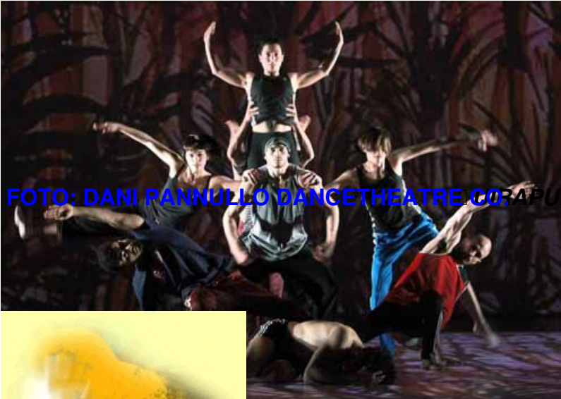
DANCETHEATRE CO. UIRAPURÚ

Miércoles, 13 de Marzo de 2013 17:13 - Actualizado Lunes, 25 de Marzo de 2013 18:13