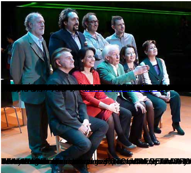
Se inspiró en la

Viernes, 19 de Abril de 2013 07:17 - Actualizado Jueves, 09 de Mayo de 2013 14:45