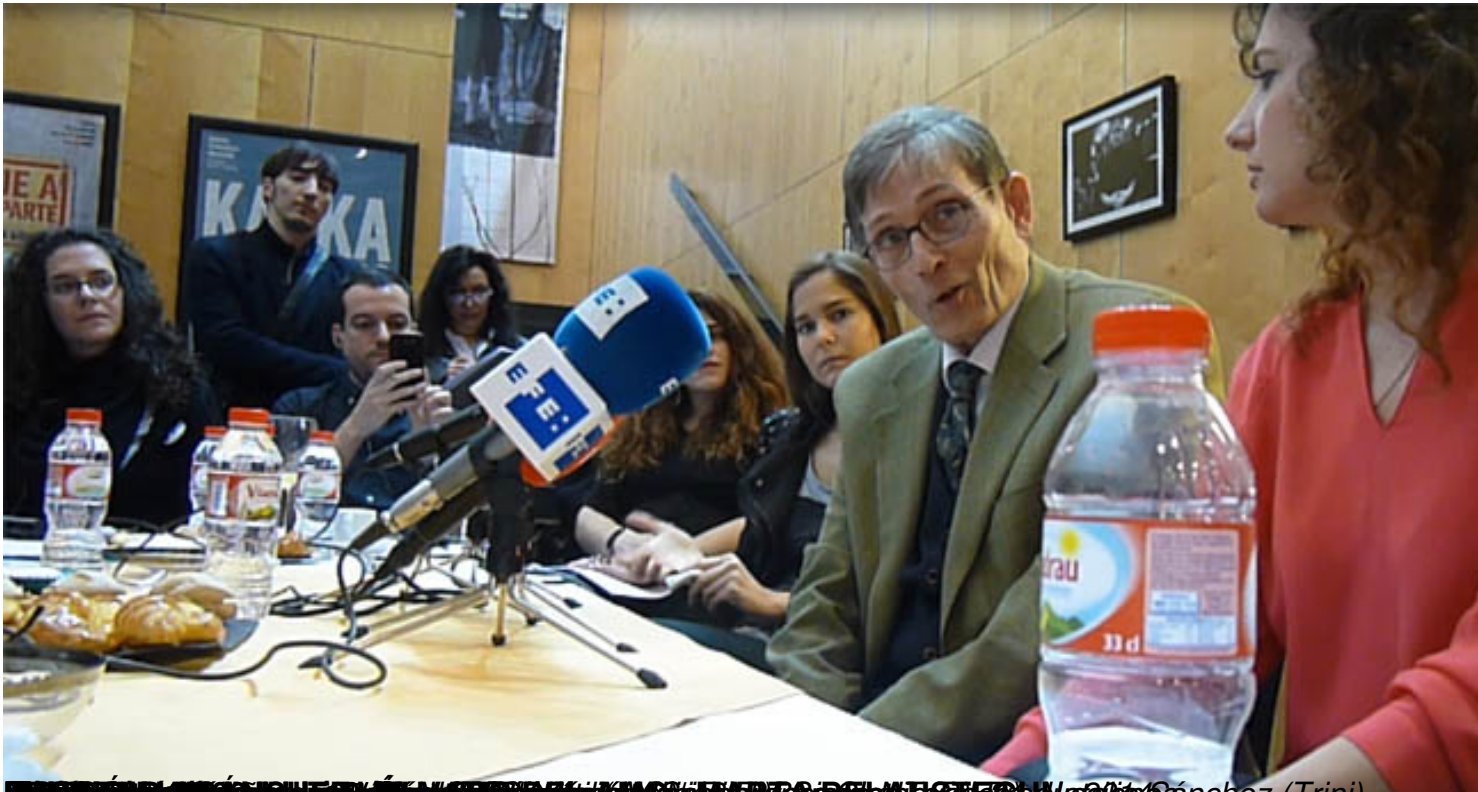
FOTOGRAFÍA DE NATALIA SANCHEZ PARA EL MONTAJE DE ALVARO DEL AMO EN EL MUSICAL "AMANTES" DE MONTAÑA SANCHEZ (Trini)

Viernes, 31 de Enero de 2014 16:34 - Actualizado Viernes, 20 de Junio de 2014 11:47