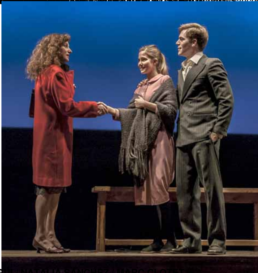
FOTOGRAFÍA DE NATALIA SANCHEZ PARA EL MONTAJE DE ALVARO DEL AMO EN EL MUSICAL "AMANTES" DE MONTAÑA SANCHEZ (Trini)